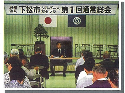
5.25 第1回 通常総会開催

昭和63年度 5月 第1回通常総会開催（市立図書館大会議室） 11月 臨時総会開催（定款の一部変更） （下松勤労者総合福祉センター内に事務所を置く） 12月 定款の一部変更認可（山口県知事） 12月 定款変更登記完了 2月 第1回会員親睦旅行（防府自由ヶ丘健康ランド）