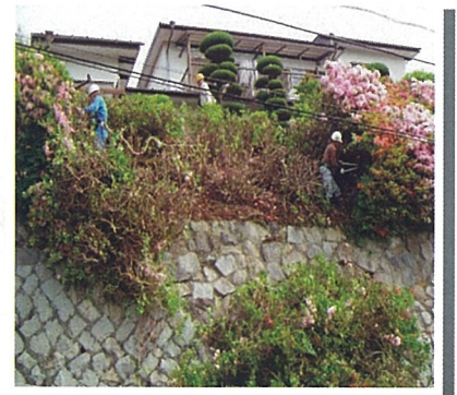
安全対策を実施した後の剪定作業風景

平成4年度 就業実績の向上によりBランクに格付け 5月 第5回通常総会及び設立5周年記念式典開催（下松勤労者総合福祉センター） 5月 会報「星のさと」記念特集号発刊（第6号） 12月 「安全委員会設置規程」施行 12月 「安全対策推進員要綱」施行 2月 「安全就業基準」施行