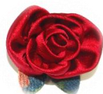
バラのブローチ (9月)