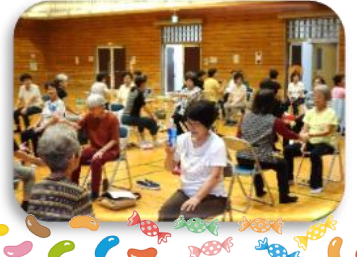
全員集合！ハイ、チーズ