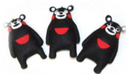
くまもんストラップ (10月)