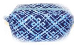
キャラメルポーチ (7月)