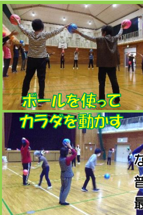
ボールを使ってカラダを動かす

なかなかハードなプログラムでひと汗かきました(笑) 普段と違う動きで脳にも刺激を与えるおもしろい内容でした！最後は音楽に合わせてみんなで踊るなど、終始楽しくすごしました♪