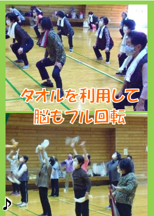
タオルを利用して脳もフル回転