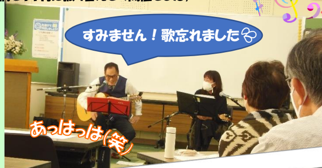
すみません！歌を忘れました