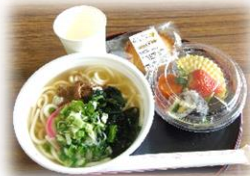
昼食は ♪うどん定食♪